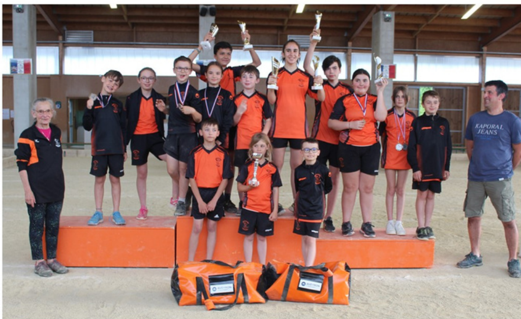
École de Quilles 2023