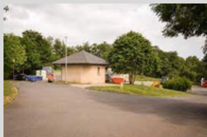
Pont de Salars